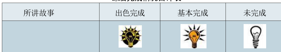
课后完成情况自评表

本课结束，课后延伸作业定为环保知识的延伸讲解，并要求学生回家之后向周围的家人普及环保知识，倡议大家注重对自然环境的保护。