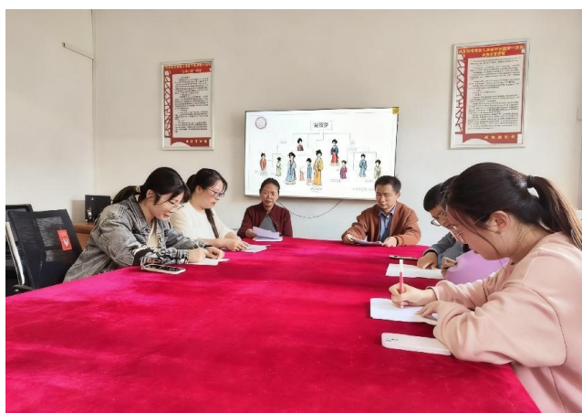
图1 教师集中利用平台资源进行备课研讨

1.教师行动（云端备课，搭建支架）：备课组不再“赤手空拳”攻红楼，而是依托平台“课程教学”板块中的《红楼梦》整本书阅读系列精品课、以及“专题教育”中的“中华经典资源库”和“影视教育”相关资源，系统梳理出“人物谱系图”、“诗词鉴赏”、“关键情节解析”、“名家点评”等多个维度的学习资源包。