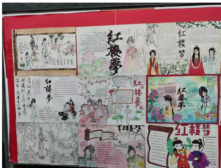
图 4 学生小组制作的以《红楼梦》手抄报展览

解决的问题：满足了不同层次学生的发展需求，将阅读输入转化为高质量的思维输出和创造性成果，实现了知识的内化与思维的透悟。