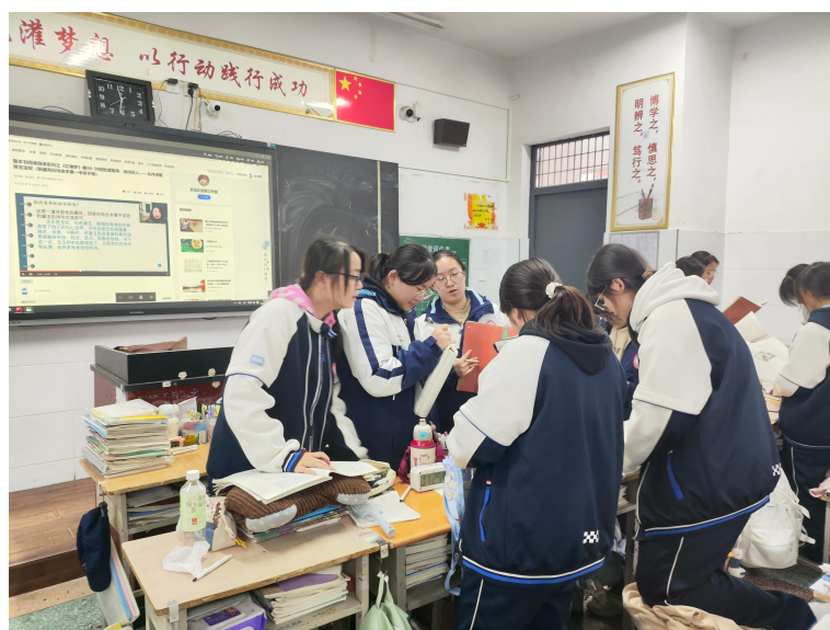
图 3 课堂辩论中教师引入平台名家观点

课堂辩论中，学生分组依据文本和预学资源展开。当讨论陷入僵局或流于表面时，教师适时引入平台资源。例如，针对“同为《红楼梦》中的才女，宝钗和黛玉的诗作在风格上有何差异？这些差异如何体现出二人的性格特质？”的问题，播放智慧平台上新疆克拉玛依第一中学于爽老师对宝钗黛玉诗作与性格关联的精细解读片段，引导学生聚焦诗作的用词、意象等文本细节，借助线上名师提供的权威学术视角和精妙文本分析方法，推动研讨走向深入。图 3 为学生讨论现场。