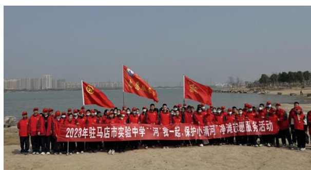
参与保护小清河行动