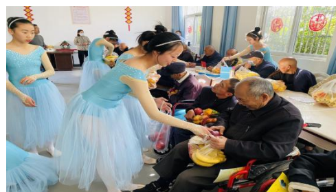
周末去敬老院慰问老人活动