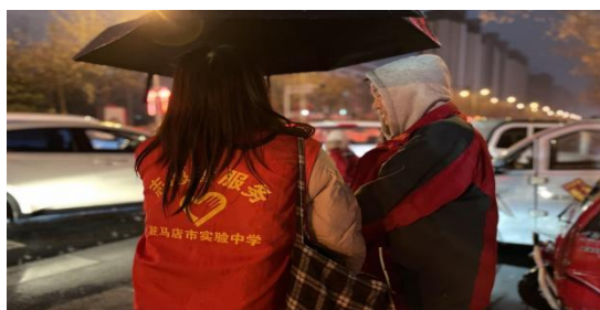
下雨天爱心守护行动